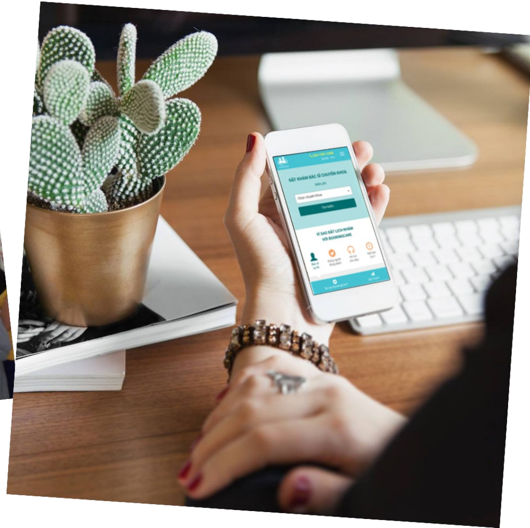
“Đi khám 4.0”