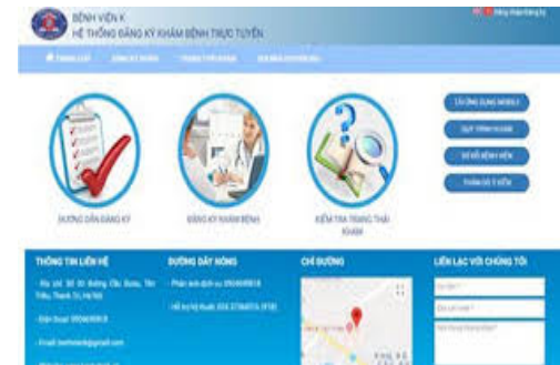
Website/App Bệnh viện