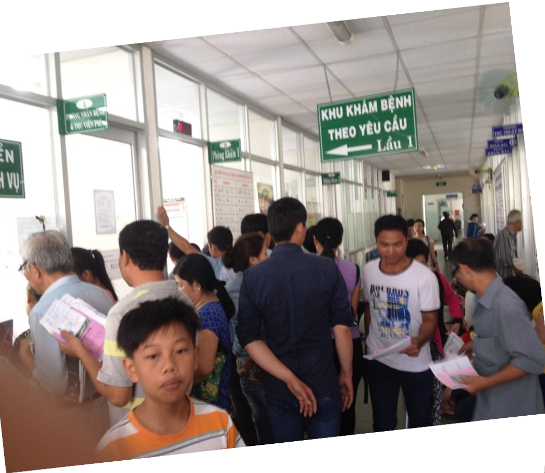
Đi khám “truyền thống”