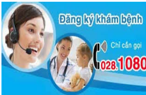
Tổng đài 1080