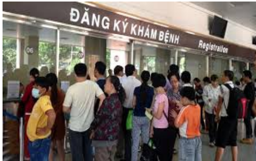
Xếp hàng lấy số