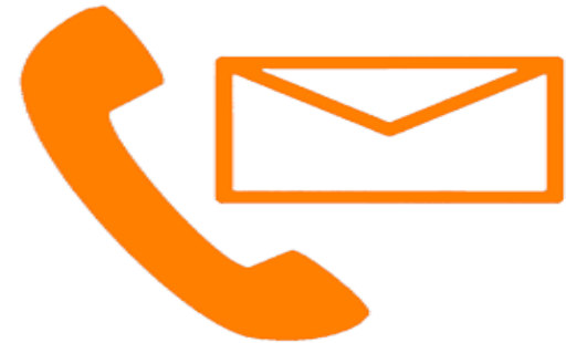
Gọi điện, nhắn tin